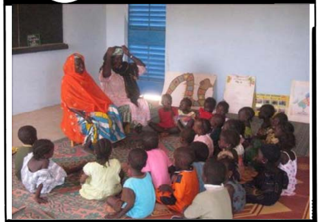
Kayanin kylän esikoululaiset opettelevat yhdessä laulun sanoja.

Toinen esikoulu, josta kerromme sinulle ylepydellä, on Tidirkaan vuonna 2003 perustettu esikoulu. Me lapset autoimme perustamisvaiheessa kertomalla tarpeistamme ja tarjoamalla ajatuksiamme ja mielipiteitämme esiopetuksesta. Olimme iloisia, kun huomasimme että aikuiset kuuntelivat meitä. Olemme kaikki osallistuneet opettajien asuntoloiden rakentamiseen ja aterioiden valmistamiseen nuoremmille sisaruksillemme. Plan auttoi meitä kouluttamalla opettajia ja esiopetustoimikunnan sekä hankkimalla luokkahuoneisiin tarvikkeita.