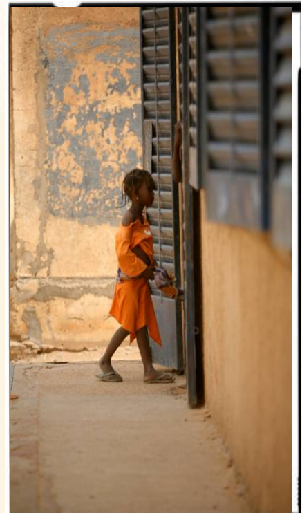
Tyttöjen esikouluopetus johtaa myös siihen, että aiempaa useammat tytöt menevät peruskouluun.

Tämän raportin valmistelivat Dosson alueella sijaitsevien Kayanin ja Tidirkaan kylien koulujen oppilaskuntien lapset. Planin työntekijät tarkistivat ja viimeistelivät raportin.